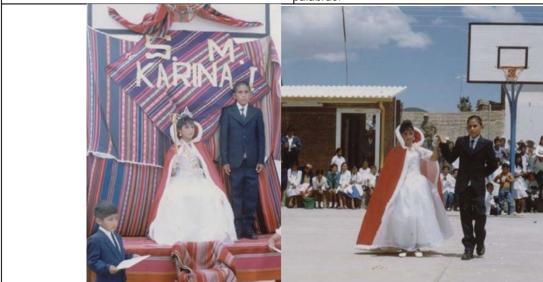
Día 21 de septiembre. DÍA DE LA PRIMAVERA, y del estudiante. Se realiza una coronación de la Reina de la fiesta (la mejor estudiante), con su acompañante, y un gran séquito de damas y caballeros. Hubo baile y juegos.