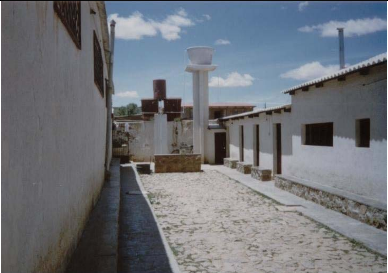
INTERNADO DE JESÚS Y MARÍA. En colaboración con ellas, comenzamos a dirigir la parte educativa del internado de Anzaldo, ellas seguían llevando la parte administrativa y de recursos. Entrada principal del internado. Un gran patio, que cubría una fosa séptica, al fondo un tanque de agua y los baños a la izquierda.