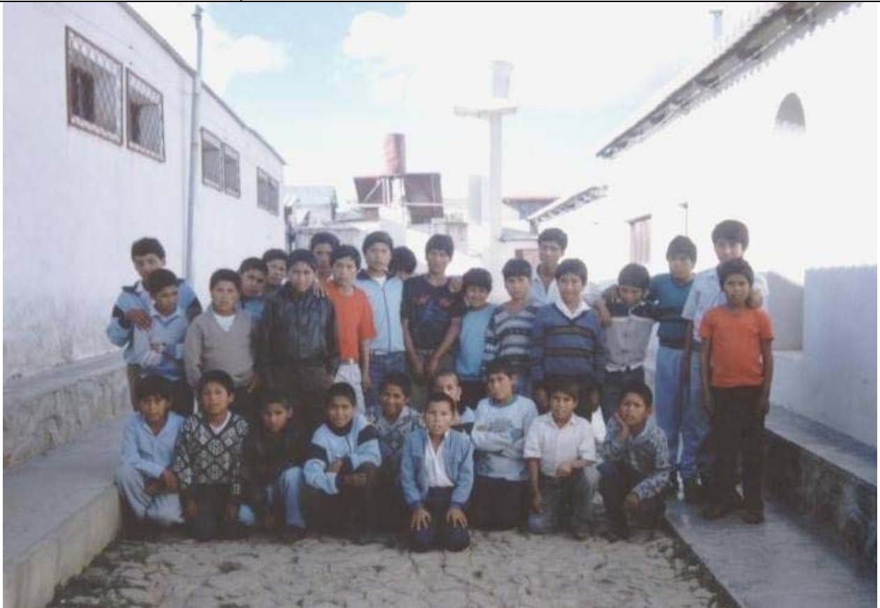
Y de los niños.