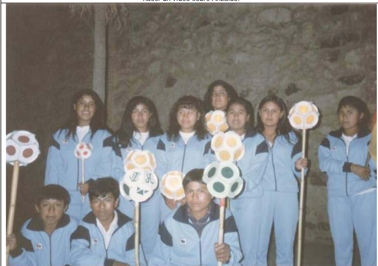
Se acerca el día de la Patria el 6 de agosto. Los alumnos se preparan el día antes para hacer el desfile de teas, unos faroles de cartulina, con los tres colores de la bandera boliviana. En la foto los alumnos de Medio.