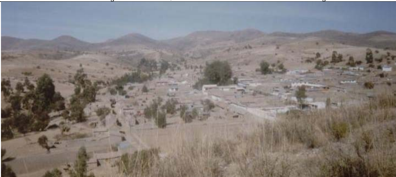
Vista general de Anzaldo, año 1993.