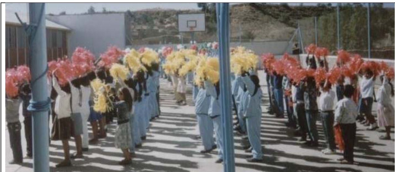
Uno de los momentos más emotivos e inesperados fue el saludo que nos brindaron todos los alumnos de la Comunidad Educativa, en honor a San José de Calasanz.