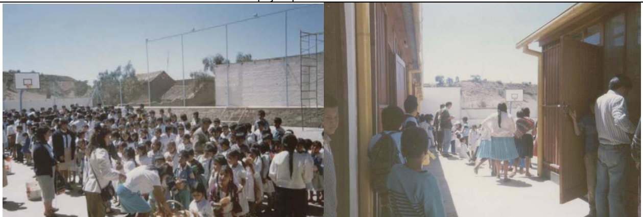
Ya en el colegio, se les repartieron a los alumnos bocadillos, preparados por las Madres de la Congregación de Jesús y María.