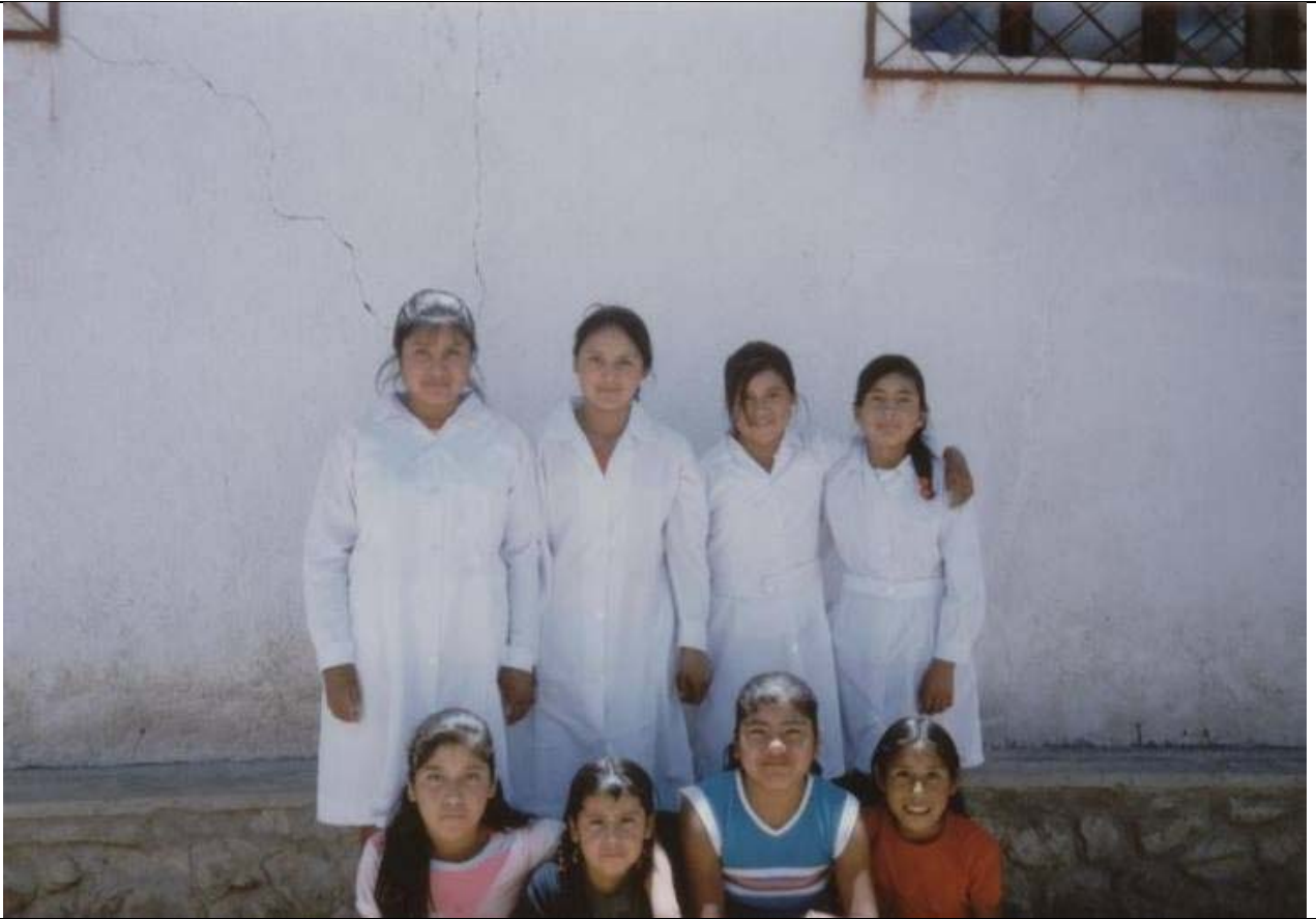
El primer año hubo 46 alumnos inscritos. Foto de las niñas.