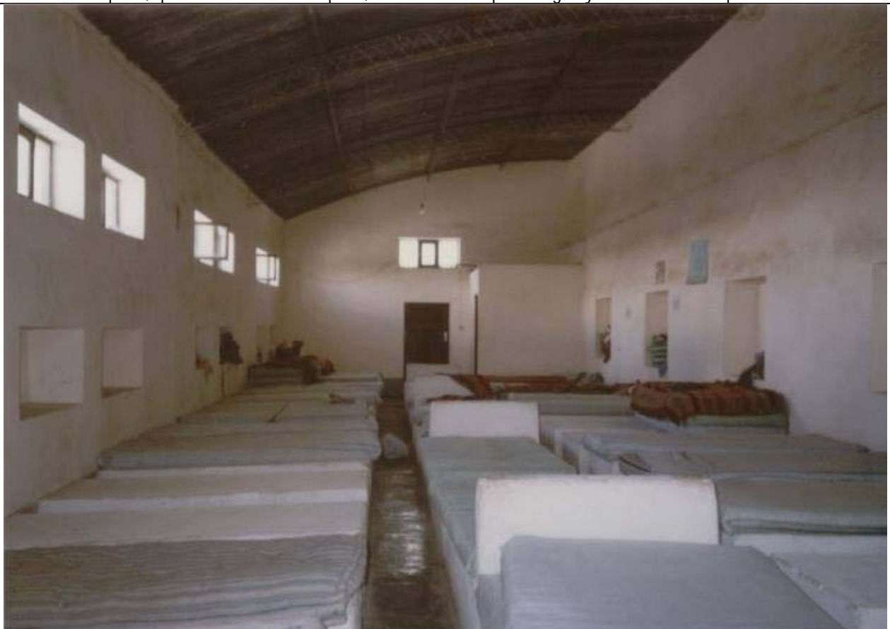
Foto de uno de los galpones donde dormían los alumnos. Un túmulo de ladrillos de adobe y encima haciendo de colchón una "payasa", varios sacos cosidos con relleno de paja.