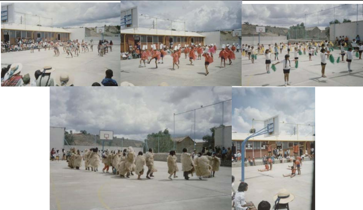
Día 26 de noviembre. Clausuramos el curso escolar. El primer año de vida de la Escuela y Misión Calasancia en Anzaldo. Fue un día de fiesta, de celebración, de agradecimiento, de esperanza...su mayor demostración, a través de las danzas populares.